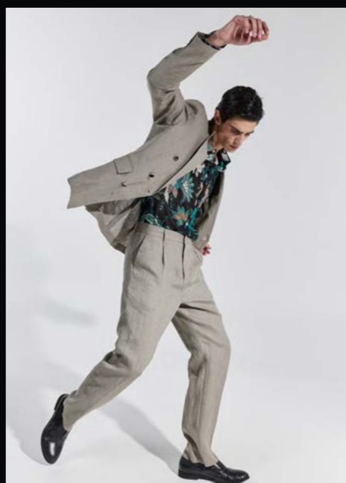
1405DP_GIACCA ART. VENERE