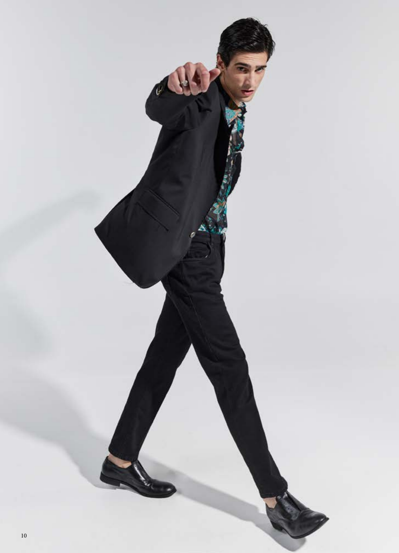
1404NN_GIACCA ART. ATENA