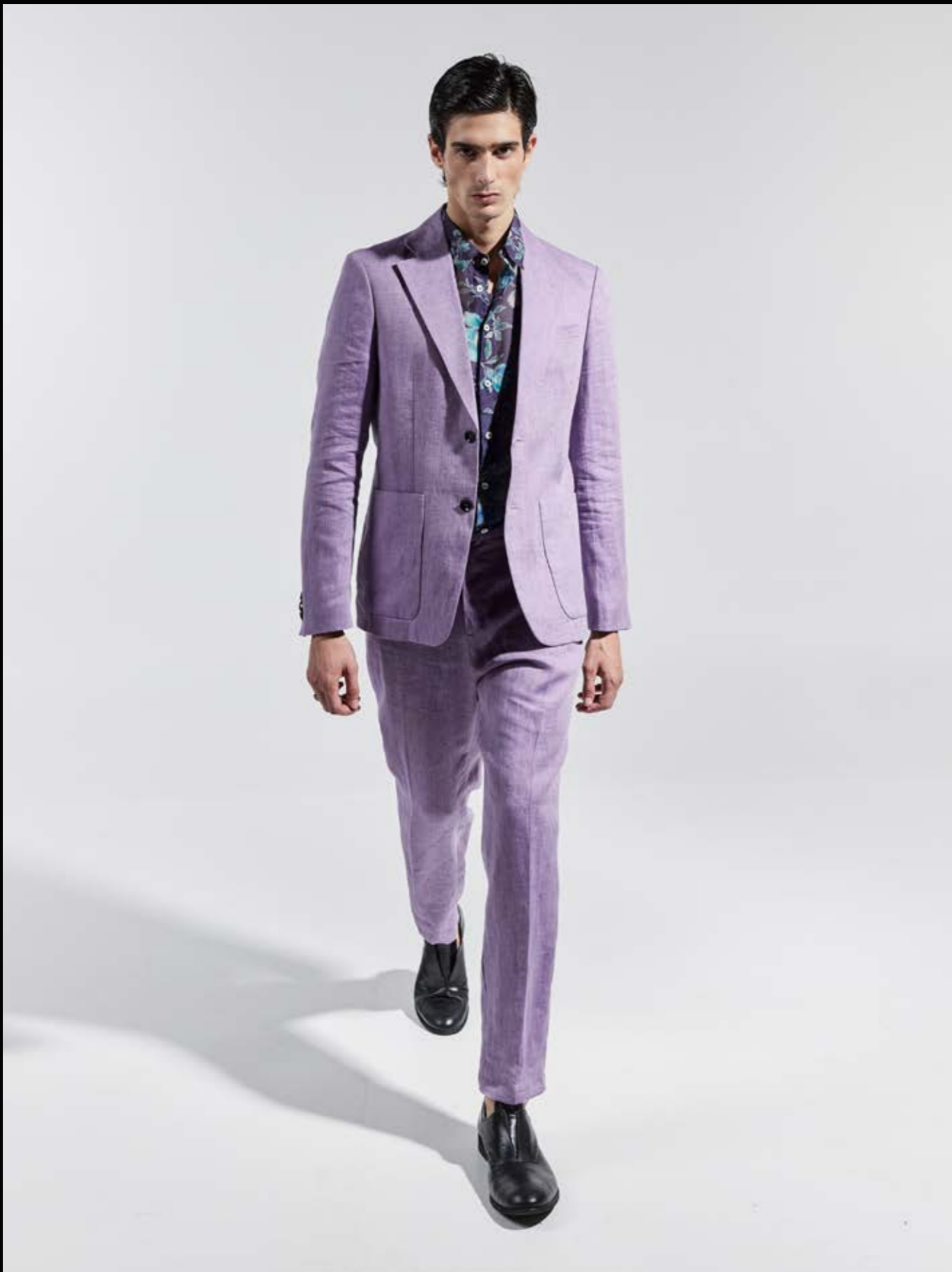
1408NN_GIACCA ART. VENERE