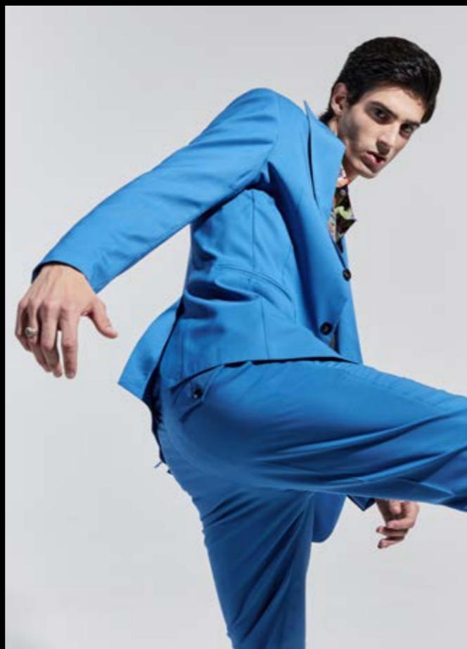
1389NN_GIACCA ART. ATENA